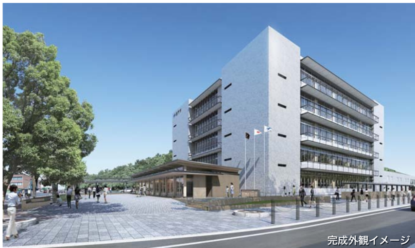
完成外観イメージ