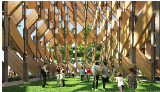
CLT晴海プロジェクト 隈研吾×三菱地所×真庭市