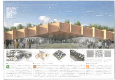
優秀賞 環境大臣賞 作品名:「CLT Web with Nature Drops」多孔質な空殻が多様な自然環境を擁う 受賞者:株式会社日建設計 Skins。