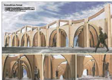
学生賞 日本CLT協会賞 作品名:「Demolition Forest」 受賞者:早稲田大学大学院 嵐 陽向