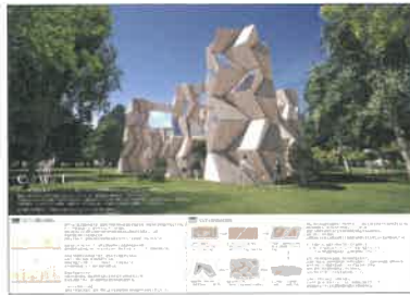
優秀賞 国土交通大臣賞 作品名:「CWT」 受賞者:株式会社大林組 中高層木造チーム