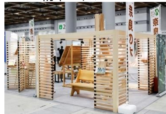
非住宅木造建築フェア