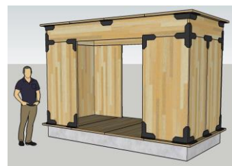
コンテナユニット

なお, 本検討に関する各社の知見は共通技術として提供いただけること, またその検討過程で事務局が守秘義務等を要求した場合は厳守することを共通の参加要件といたします。