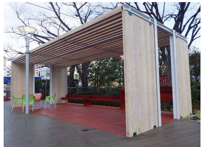
CLT技術開発 【パーゴラ】