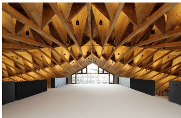
【事例1】株式会社コスモスウェブ（社屋） 県内初の3階建CLT建築 CLTパネル工法（ルート2）