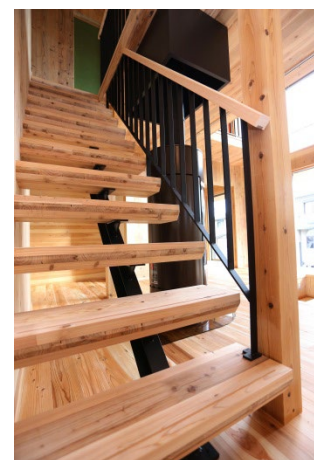
内外装にCLTを使用した住宅