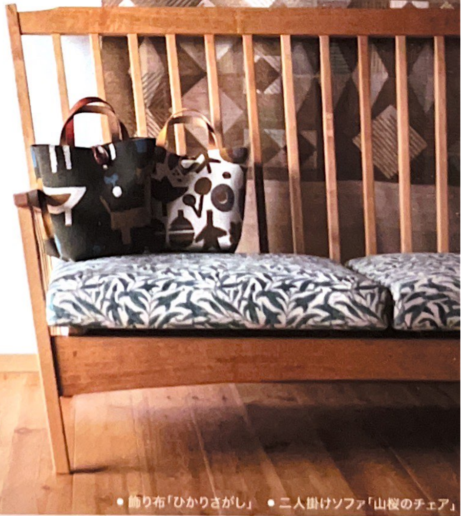
● 飾り布「ひかりさがし」 ● 二人掛けソファ「山桜のチェア」