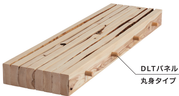
DLTパネル 丸身タイプ