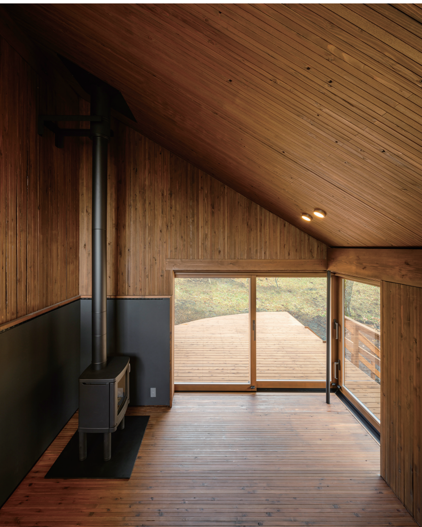
壁・床・天井への使用例。 作品名『DLT HUT』 設計：山中祐一郎・菊地ゆかり S.O.Y.建築環境研究所